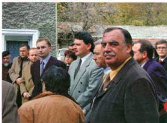
Областният управител и кметът ротарианец взеха участие в откриването на обекта