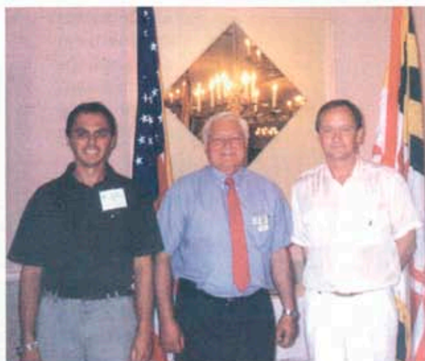
и с президента на РК - Хегерстаун