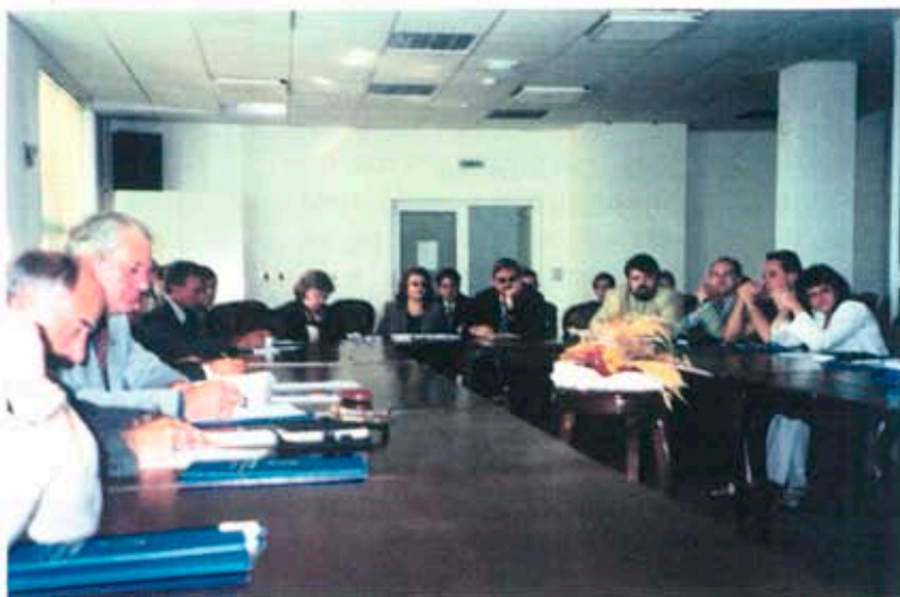
Участниците в Асамблеята

Поради всичките тези причини се налага да се разгърне широка и ак-