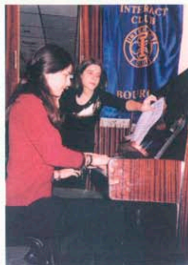
Интеракт изнесеха празничен концерт