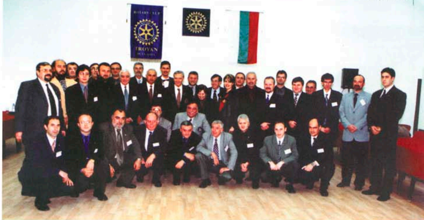
Членовете на Ротари клуб - Троян, и гостите на тържеството