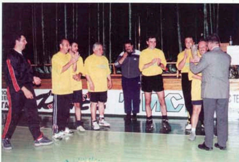
Победителите получават своите награди