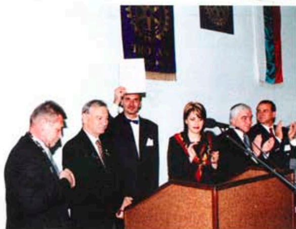
Президентът на РК - Троян, Христо Варчев с чартърния лист