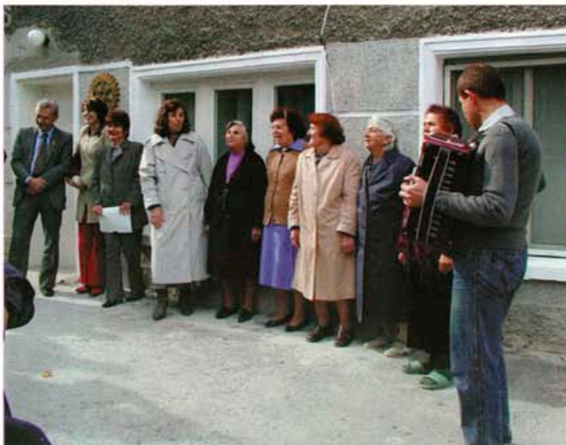
Възрастните хора ни изпяха песен с оригинален текст с благодарност към Ротари и управителката на Дома